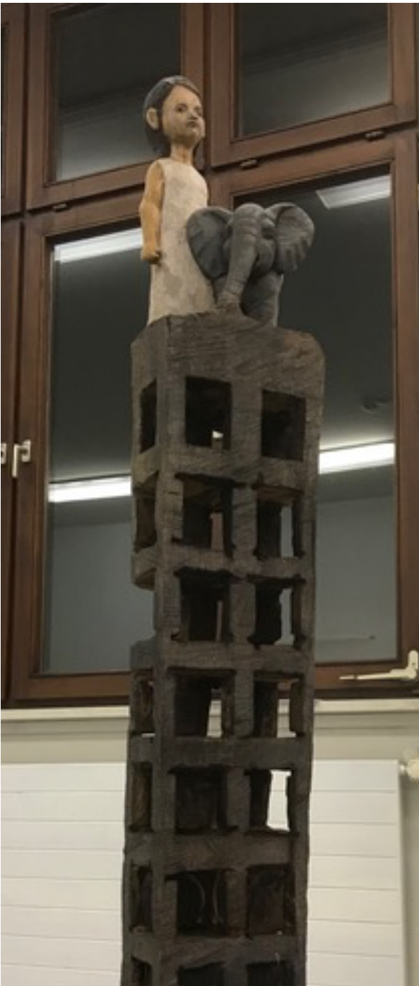
Holzskulptur von Jane Weiel